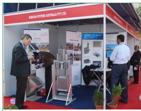
Une exposition fut tenue lors de la 5 ème CRAs où les équipements et matières d'irrigation ont fait l'objet d'étalage, cette exposition étant organisée par une trentaine d'agences gouvernementales, des organisations privées et des entreprises indiennes et étrangères du secteur d'eau