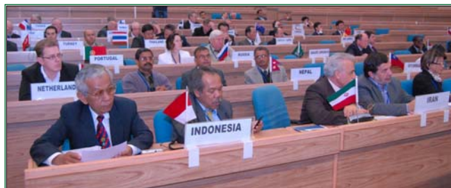
31 Comités Nationaux/Comité, Présidents Hons. et des organisations internationales ont participé au Conseil Exécutif International (CEI)