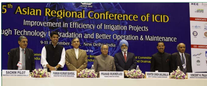
La cérémonie de clôture fut tenue en présence du Ministre des Finances Dr. Pranab Mukherjee hôte d'honneur, et d'autres personnalités - Ministre des Ressources en Eau M. Pawan Kumar Bansal; Vice Président de la Commission de Planification Dr. Montek Singh Ahluwalia; Ministre d'Etat aux Ressources en Eau M. Vincent Pala; et Ministre d'Etat aux Communications et à la Technologie d'Information M. Sachin Pilot