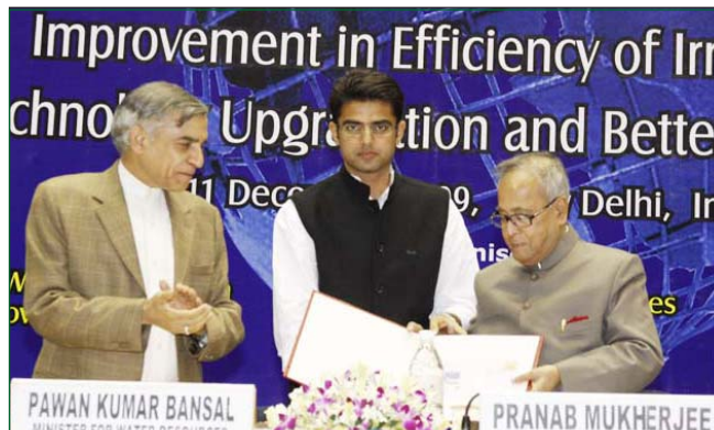
Pour marquer le Jubilé de Diamant CIID (1950-2009), une enveloppe spéciale fut publiée par le Ministre d'Etat aux Communications et à la Technologie d'Information, en présence du Ministre des Ressources en Eau M. Pawan Kumar Bansal, et du Ministre des Finances Dr. Pranab Mukherjee