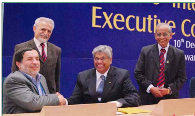
Un Mémoire d'Accord (MoU) fut signé par l'intermédiaire de l'IRNCID entre le Président Chandra Madramootoo et S.E. Mohammad Reza Attarzadeh, Ministre adjoint des Eaux et des Eaux perdues de la République Islamique de l'Iran